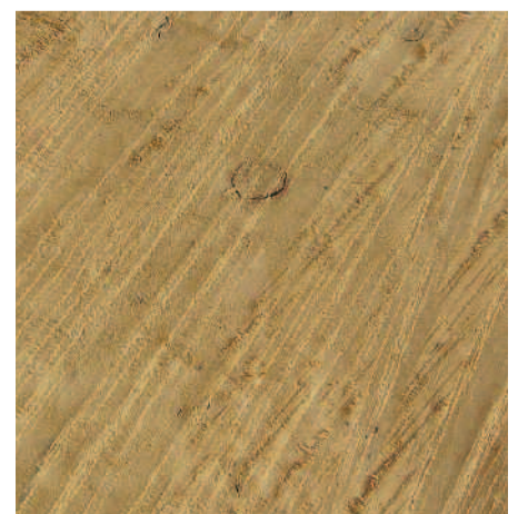
Materialmuster, Eichenholz, kettengesägt