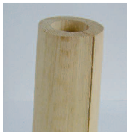
Ansicht seitlicher Einschnitt