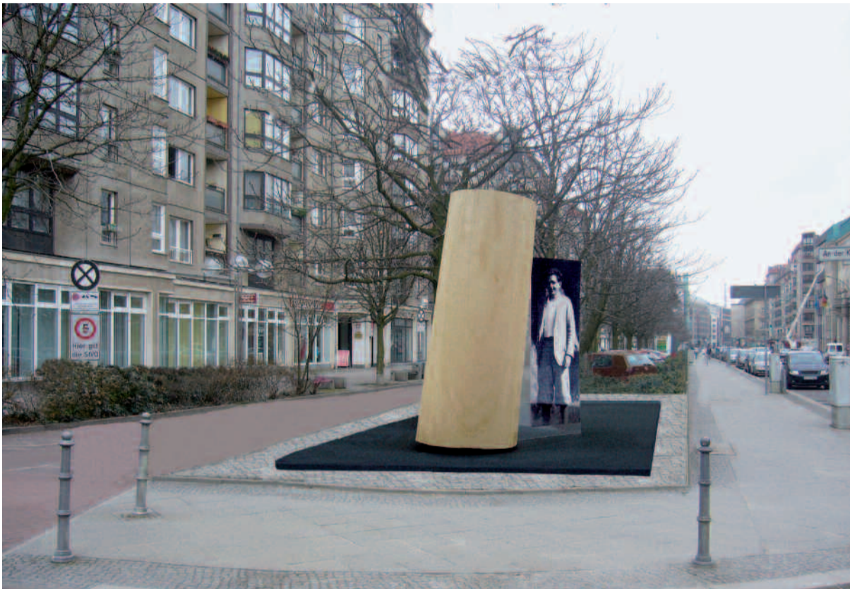
Denkzeichen Georg Elser am möglichen Standort Wilhelmstraße / An den Kolonnaden, M 1:20

Das Material Glas symbolisiert die Sensibilität und letztlich auch die Verletzlichkeit Georg Elzers, die in diesem Unrechtsregime ihr bitteres Ende nahm.