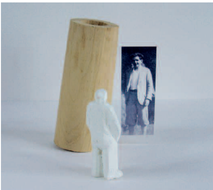
Modell Denkzeichen Georg Elser, M 1:20